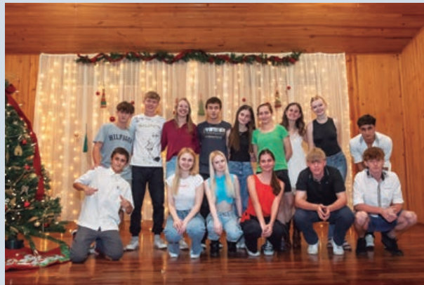
Grupo de Jóvenes

sonería Jurídica con el nombre de Asociación Suiza de Eldorado. El 7 de julio de 1995 se colocó la piedra fundamental en el predio donde actualmente funciona, en la calle Santiago 2629-Km 10.