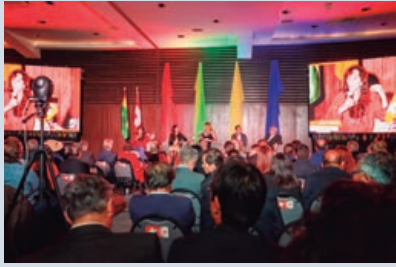
Una numerosa concurrencia sigue el detalle de los aportes de trabajo en diversos ámbitos