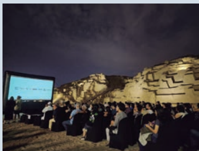
Inauguración “Locarno en Lima” en el Complejo Arqueológico Mateo Salado/Pueblo Libre/Lima