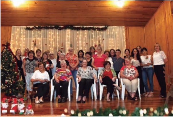
Sub Comisión de Damas

tándose en la zona llamada “Picada Suiza”. Se refirió a las tradicionales fiestas del 1° de agosto en las que celebraban la Fiesta Nacional Suiza con juego de cartas de Jazz, truco argentino, tiro al blanco y entretenimientos con premios para los niños. También hizo referencias a los festejos de carnaval en los que se adornaba el salón con anticipación y se compartía el tradicional Fasnachts Kùchle, una masa dulce que se fríe y es típica de la festividad de Carnaval en Suiza.