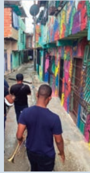
Murales del proyecto social “Guaguancó de colores” (II)

Luego, la fundación “100% San Agustín” ofreció un tour, con un paseo en teleférico, música en vivo, comidas típicas y una pintoresca caminata. Los participantes de esta salida anual conocieron lugares emblemáticos como el Teatro Alameda, el Club “Los Alegres All Star” y los murales del proyecto social “Guaguancó de colores”. Los guías explicaron cómo la comunidad local erradicó la delincuencia y convirtió a San Agustín en un referente del turismo urbano alternativo.