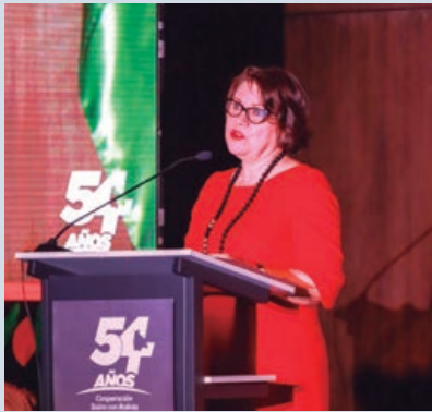
La Embajadora de Suiza en Bolivia, Edita Vokral, dirige las palabras en el evento