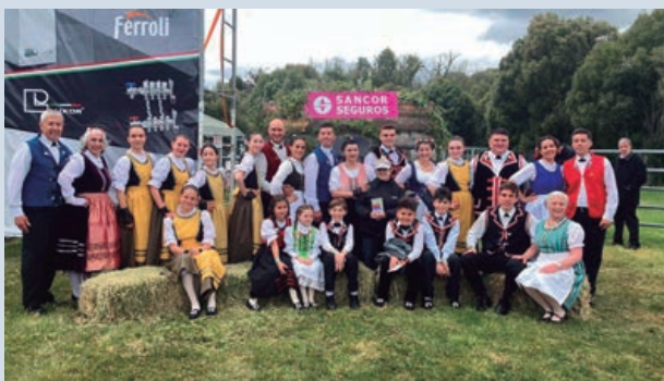
La colectividad suiza en la Fiesta de las Colectividades Europeo-Argentinas

(MARÍA CRISTINA THEILER / CAROLINA GALLMANN-SECRETARIA)