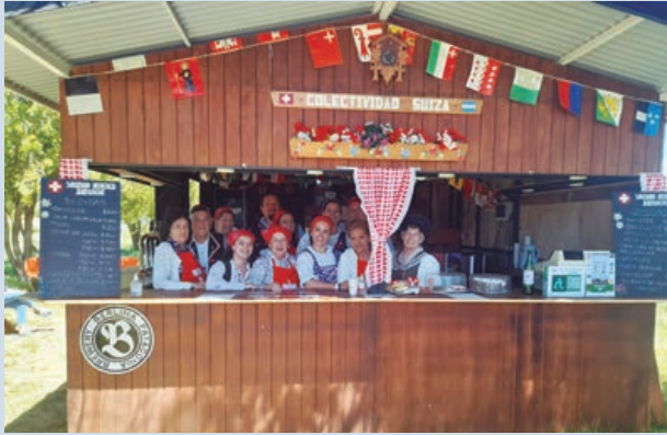
Stand de la Sociedad Helvética Bariloche

15.000 habitantes y los inmigrantes de diferentes países europeos y sus descendientes integraban un importante grupo.