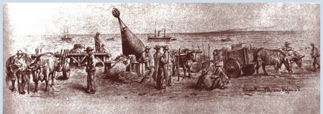
(Dibujo de Teodoro Ohlsen 1883)

Lo que no sabían estos suizos era que Punta Arenas era una Colonia penal, donde traían desde todo el país a reos que cumplían sus penas en confinamiento. A los suizos recién llegados les tocó vivir el sangriento Motín de los Artilleros en noviembre de 1878, en el que los presos junto a los oficiales y guardias que los resguardaban tomaron la ciudad durante tres días. Punta Arenas fue incendiada, saqueada y los habitantes huyeron a los cerros cercanos; hubo muchos muertos y heridos. Después de lo sucedido, la mayoría de