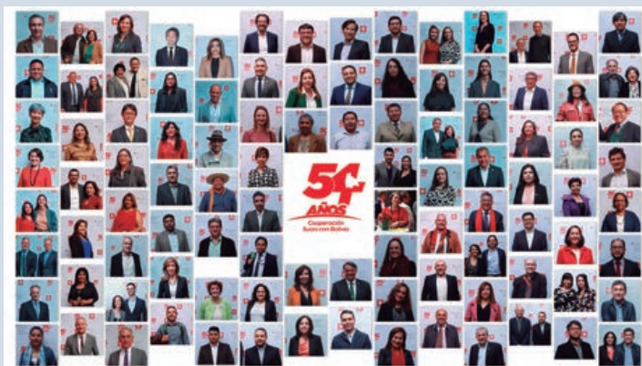
Mosaico conmemorativo con participantes del evento