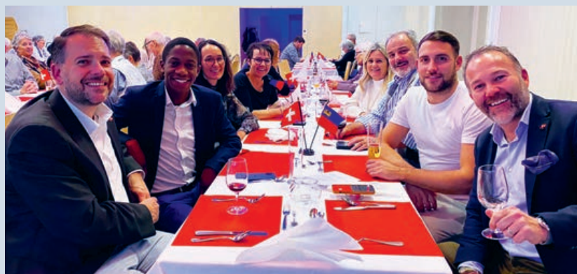
Ausgelassene Stimmung an der Generalversammlung

Herzlichen Dank allen Mitgliedern, Sponsoren und Gönnern des Schweizer Vereins im Fürstentum Liechtenstein für die tatkräftige Unterstützung unseres Vereins.