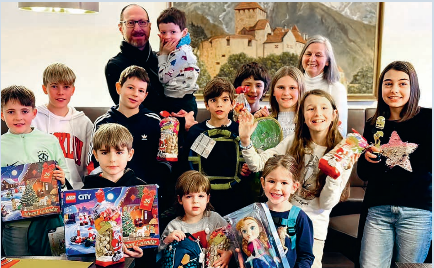
Ein Adventsgeschenk für alle Kinder