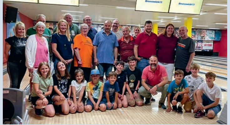
Die Teilnehmenden hatten sichtlich viel Spass