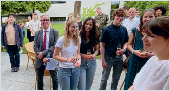
Jungbürgerfeier vom 23. Juni 2023 im Hotel Schatzmann / Restaurant Vivid