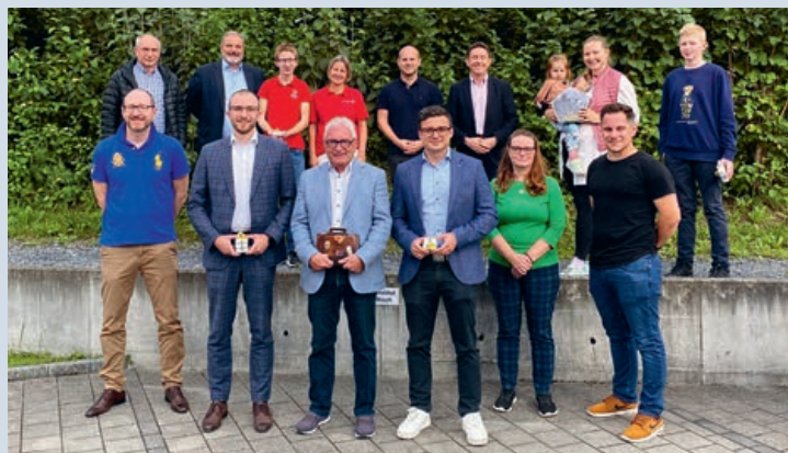
Die Preisübergabe für das Entenrennen fand am 30.08.2023 im LoBistro statt