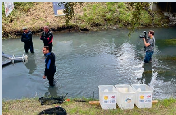
Spannung beim Zieleingang

Am 1. August 2023 ging das allseits beliebte Entenrennen bereits zum 15. Mal über die Bühne resp. in den Kanal; es war also eine Jubiläumsausgabe. Bereits um 15 Uhr hatten sich bei bestem Wetter viele Familien mit Kindern in Ridamm City zum Familienplausch eingefunden. Es gab eine Westernolympiade für Klein und Gross mit zahlreichen Aktivitäten. Auch das Kinderschminken war sehr beliebt.