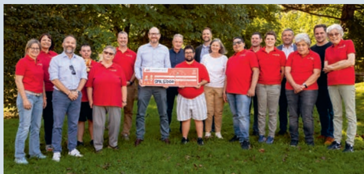
Scheckübergabe an Special Olympics Liechtenstein am 26.09.2023

Besten Dank für die grossartige Organisation und allen zahlreichen freiwilligen Unterstützern für die wertvolle Mithilfe!