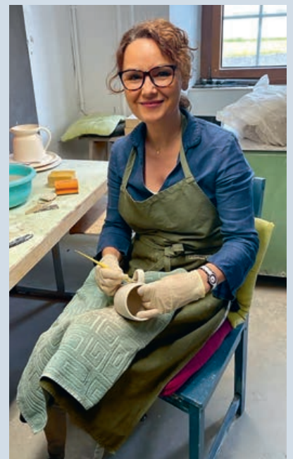
Bei der Herstellung in der Keramikwerkstatt