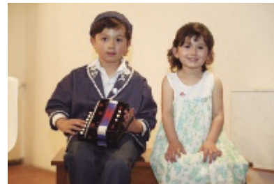
Actuación del Grupo musical inter-clubes