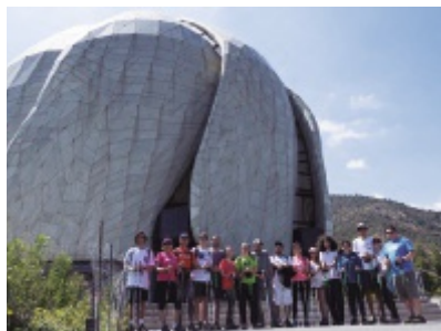
El grupo frente al Templo Bahá'í

deportivo-recreativa se realiza con dos bastones, diseñados con tecnología específica para la disciplina, lo que permite desarrollar un ejercicio efectivo y eficaz en todo el cuerpo, mejorando la fuerza muscular, el sistema cardiovascular, la coordinación y la movilidad.