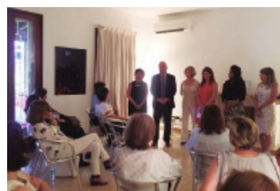
Asamblea General Damas Suizas

Con la doble finalidad de reunir a la Comunidad y realizar un trabajo be-