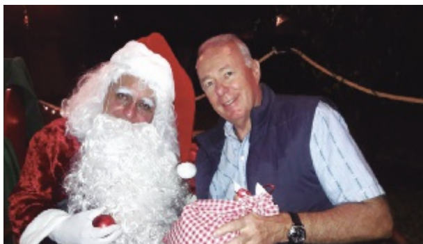
Samichlaus y el Embajador Hans-Ruedi Bortis

Durante su primer año de actividad, la Cámara organizó eventos de intercambio informativo con el Ministro de Fi-