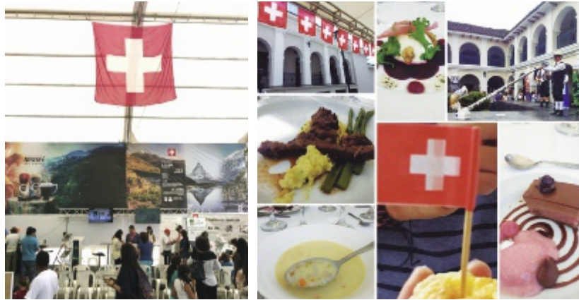
Stand de Suiza en Popayán