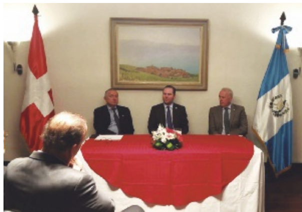
Evento con el Presidente del Congreso Sr. Álvaro Arzu

Para el 2019 ya está programada una agenda llena de actividades como la primera Asamblea General, una Feria en el marco de la Fiesta Nacional y conservatorios con candidatos presidenciales. (EMBAJADA DE SUIZA EN GUATEMALA)