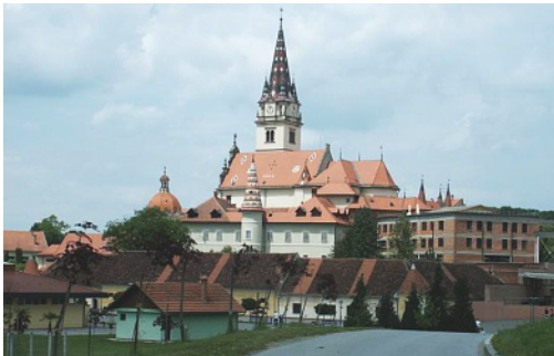
Das Nationalheiligtum Marija Bistrica