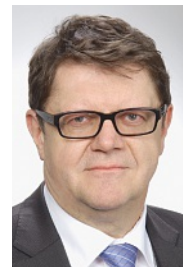
IVO DÜRR, REDAKTION