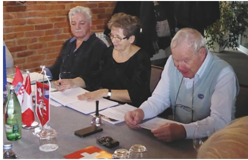
Kassier, Vizepräsidentin und Präsident