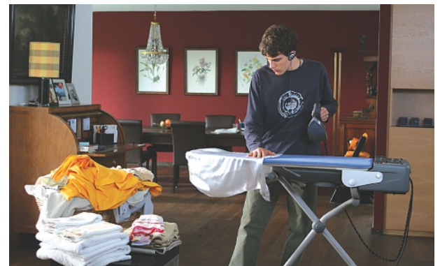
„Jeune homme“ von Christoph Schaub

Das detaillierte Programm des FFF'18 finden Sie ab Anfang April unter www.fffwien.at . Wir freuen uns auf Ihren Besuch!