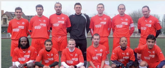
Equipe «Fanion» saison 2008/2009