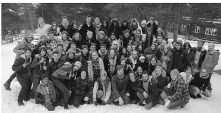
Camp d'hiver pour Suisses de l'étranger

A noter que l'OSE collabore également avec la Fondation Oeschger-Hintermann qui vient en aide aux Suisses d'Argentine.