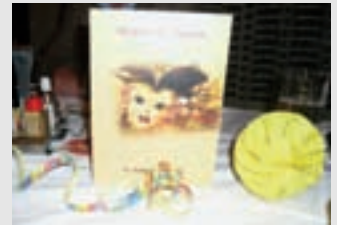
Die Speisekarte – liebevoll von unserem Wirt gestaltet