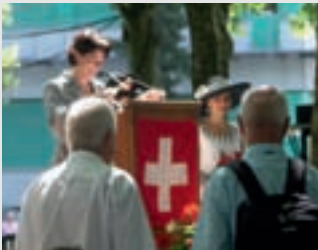
Festrednerin Doris Leuthard

noch etwa die Hälfte der wackeren Schützenschar.