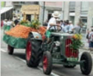
Aus dem Rüebli-land

Beim traditionellen Vergleichsschiessen mit dem Militärkommando Wien gab es für uns auch nur Erfreuliches. Zum vierten Mal in Folge gewann die SSG 1