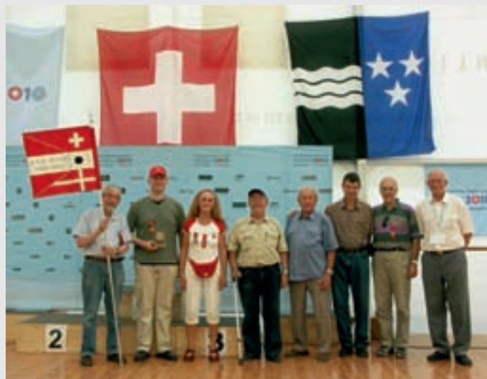
Die stolzen Medaillen-Gewinner

Den Festakt und den Umzug erlebte am nächsten Tag nur